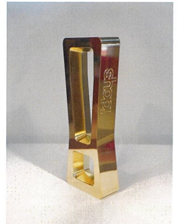
世界共通の業界最高栄誉のシンボル Shop! OMA トロフィー

JPM POP CREATIVE AWARDS Officially licensed by shop! Enhancing Retail Environments & Experiences